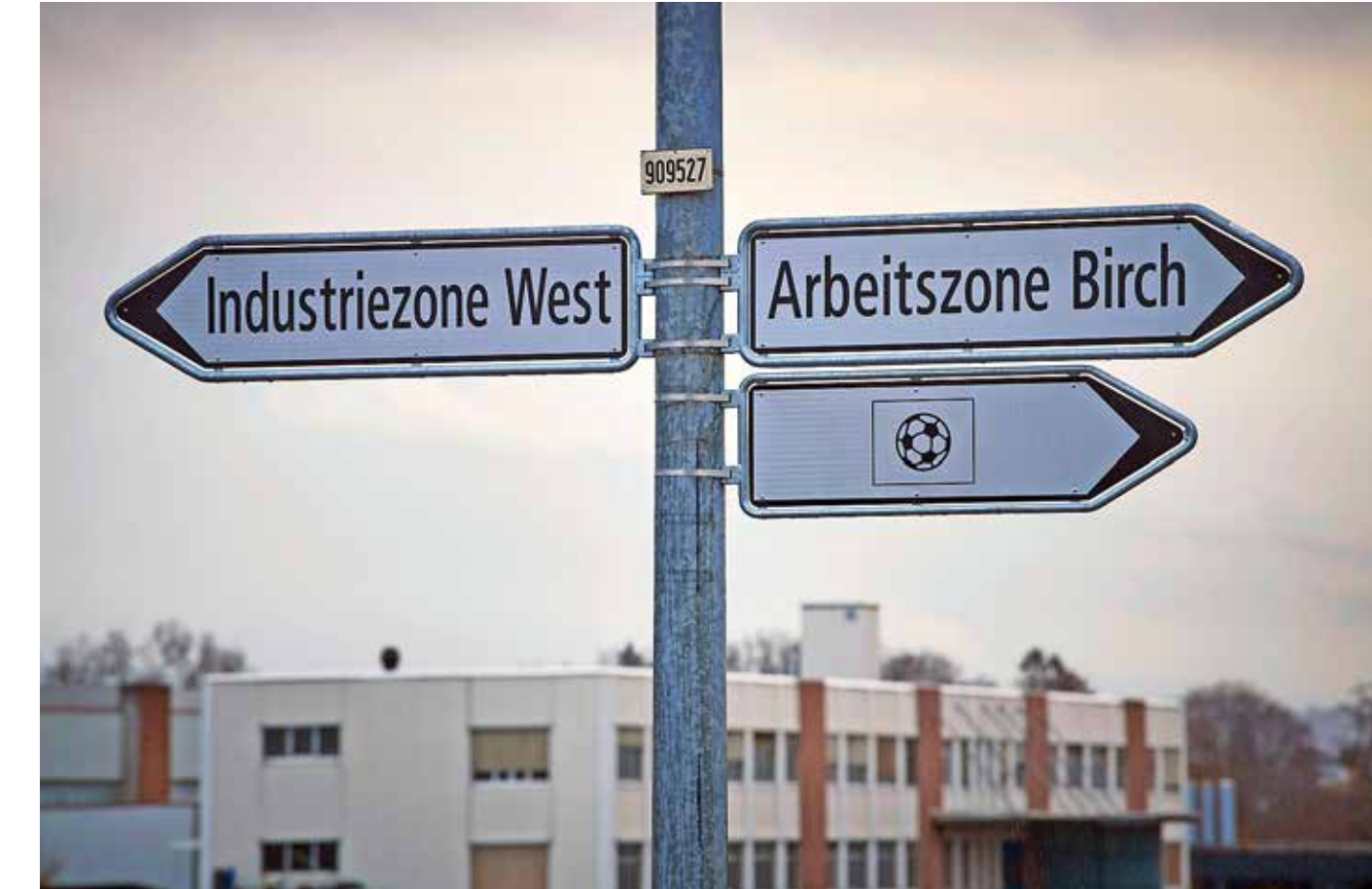
Der künftige Arbeitszonenmanager soll dem Sensebezirk helfen, die Übersicht über die verfügbaren Arbeitszonen zu behalten.