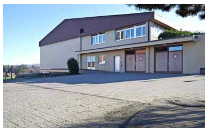
Das Mehrzweckgebäude von St. Ursen.

ST. URSEN Die Gemeindeversammlung St. Ursen hat am Dienstagabend Corona-bedingt im Mehrzweckgebäude getagt. Das traf sich gut, denn um das Mehrzweckgebäude ging es an der Versammlung. Das Gebäude mit Turnhalle, das 1980 eingeweiht und 1998